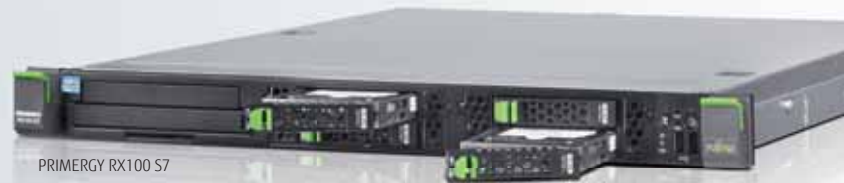
PRIMERGY RX100 S7

* Gilt für alles Fujitsu PRIMERGY und ETERNUS Angebote bei einer Leasinglaufzeit von 24 oder 30 Monaten. Zur Errechnung eines persönlichen Angebotes stehen wir Ihnen jederzeit gern zur Verfügung: financialservices@ts.fujitsu.com