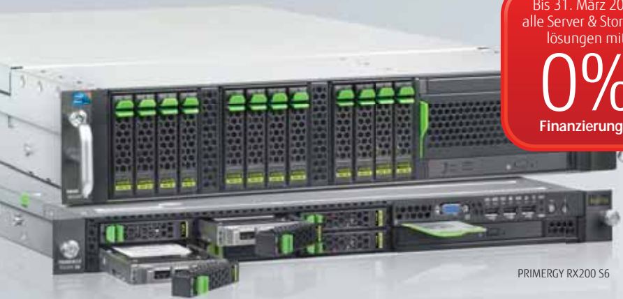
PRIMERGY RX200 S6

Bis 31. März 2012 alle Server & Storage- lösungen mit 0% Finanzierung!