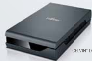
CELVIN® DRIVE D100

Brutto 1 69,- Netto 2 57,98 Leasingrate 4,5 1,93